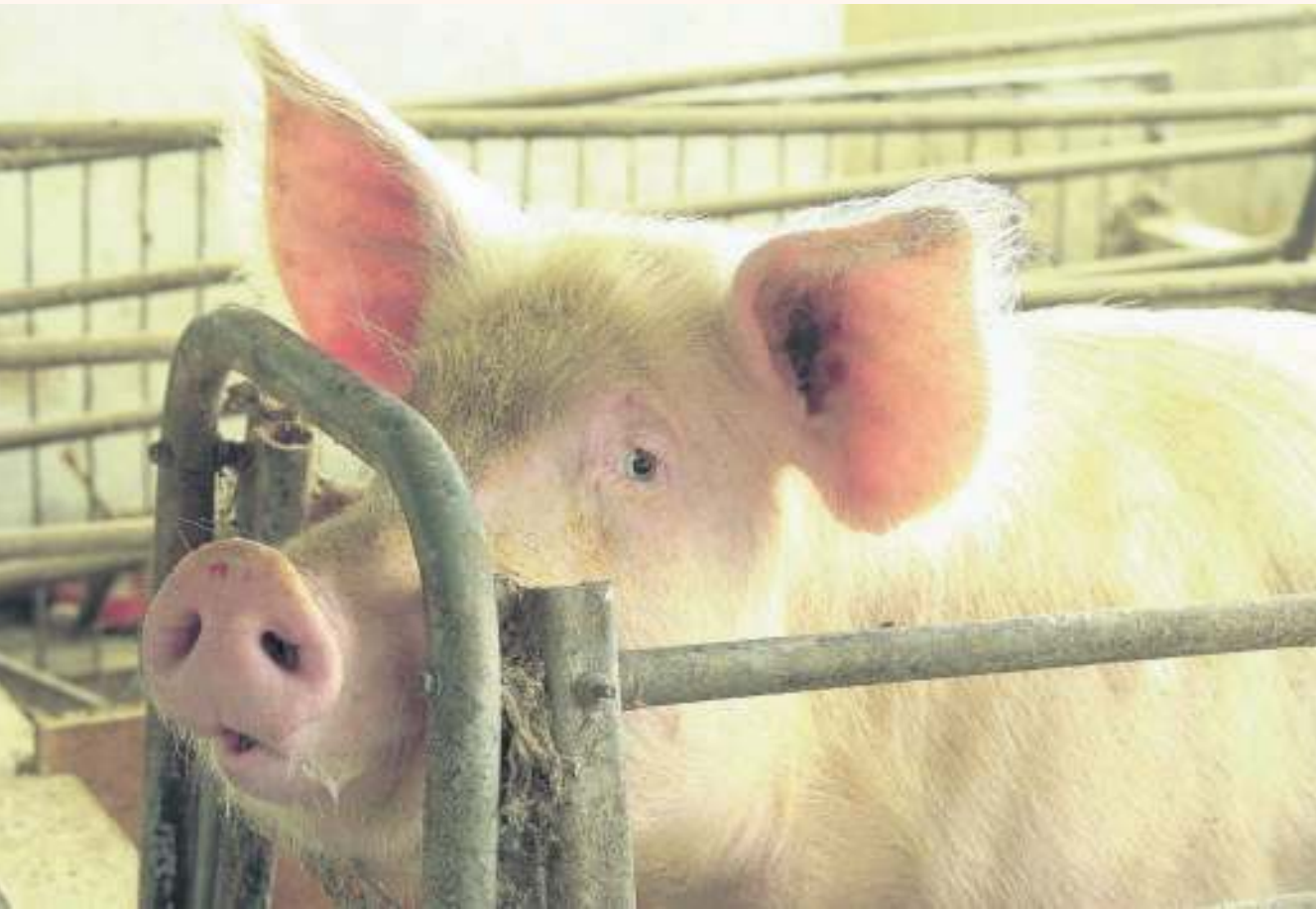
Cooperativa Caluprocerd en San Jacinto.

que es una propuesta que tenemos que ver si podemos replicar en todas las intendencias en este 2024, y también en 2025”.