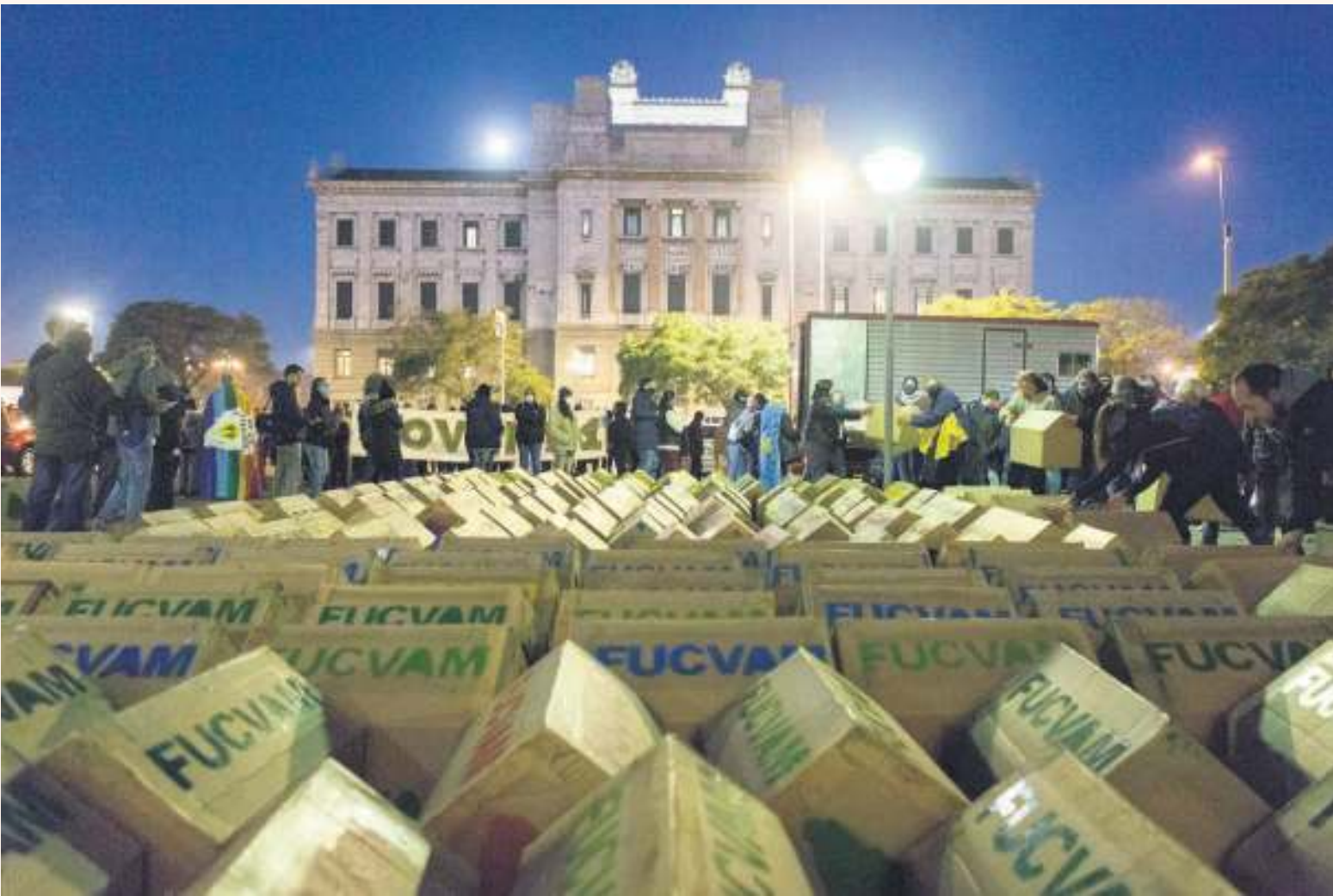
Manifestación de FUCVAM, frente al Palacio Legislativo. FOTO: ERNESTO RYAN (ARCHIVO, JUNIO DE 2020)

demora para acceder al préstamo que una vez que lo consiguen no pueden escriturar porque se superó el plazo. “Habría que agilizar porque la gente tiene una necesidad básica a cubrir y no podemos estar dilatando por cuestiones administrativas, reglamentarias, el derecho que tienen las personas a una vivienda digna”, concluyó.